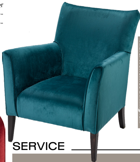
A.B.C. Worldwide Birmingham