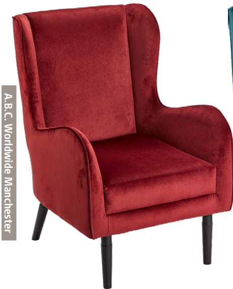
A.B.C. Worldwide Manchester

Ob Theke, Tresen oder Loungemöbel – bei der Einrichtung von Gastronomieräumen zählt neben Funktionalität vor allem das stimmige Gesamtbild. Objekt-m ist spezialisiert auf hochwertige Möbel für die Gastronomie und überzeugt mit einem breiten Sortiment: Von schnell verfügbarer Lagerware bis hin zu individuell konfigurierbaren Lösungen. Aktuelle Projekte wie die Einrichtung der Monte Bar Erlangen mit dem eleganten Exkludor Sessel , das Café Heiners in Bad Staffelstein oder die maßgeschneiderte Stilla-Bank im Erck Flair Hotel Bad Schönborn zeigen die gestalterische Bandbreite des Unternehmens. Auf Wunsch übernimmt ▶