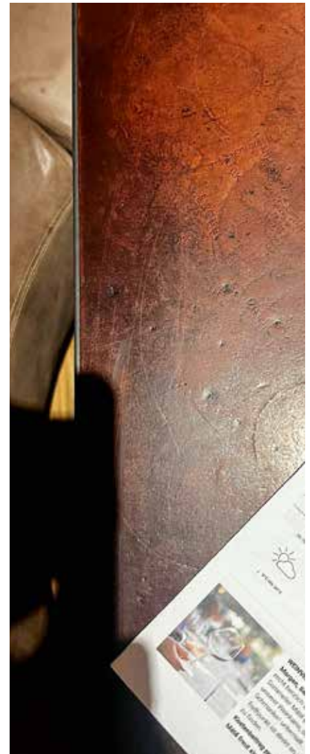
Je „oller, je doller“: Tischplatten aus Leder. Geplan Design belegte Platten von Restauranttischen mit Kernleder. Sie wirken warm und weich, sind robust und entwickeln eine charmante Patina.

von Schichtstoffplatten sind zudem die Kanten immer eine Schwachstelle. Sie sind unschön und anfällig gegen Stöße – wohingegen eine Massivholzkante auch mal eine „Macke“ haben darf oder nachgearbeitet werden kann. Die besten Restauranttischplatten, die wir mit unserem Büro bisher umgesetzt haben, sind mit Sattel beziehungsweise Kernleder belegt. Sie sind warm, weich, robust, werden mit der Zeit immer schöner und können mittlerweile visuell Geschichten aus fast zehn Jahren erzählen.