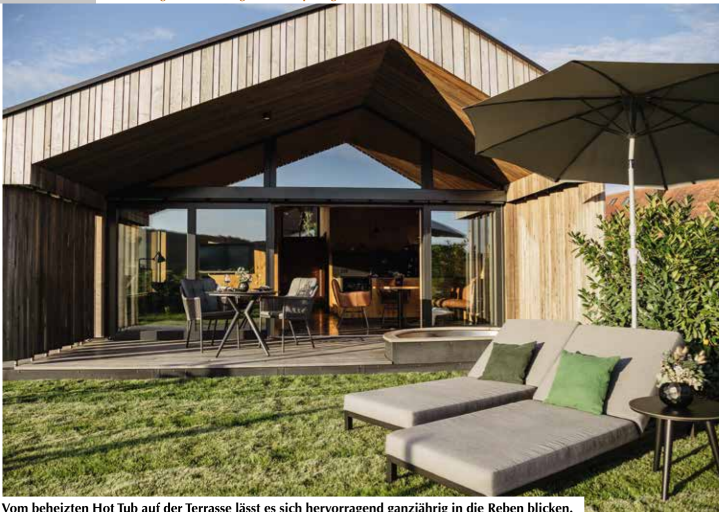
Vom beheizten Hot Tub auf der Terrasse lässt es sich hervorragend ganzjährig in die Reben blicken.