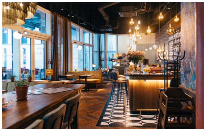
Im neuesten „L'Osteria“-Restaurant wurden hochwertige Materialien verwendet.

Im Frankfurter Einkaufszentrum MyZeit hat Generalübernehmer Schwitzke Project den Komplettausbau des neuesten Restaurants der „L'Osteria“-Kette, die übrigens 1999 als „netter Italiener von nebenan“ in Nürnberg entstand, realisiert. Innerhalb von 12 Wochen wurden die 700 qm Fläche eines ehemaligen Restaurants der Sander-Unternehmensgruppe den Anforderungen entsprechend umgestaltet: Lüftung, Klimaanlage sowie drei Kühlhäuser wurden vom Vormieter übernommen, die Struktur der Nebenräume wie Personalräume, Büros und Lager hingegen für „L'Osteria“ passend verändert. Für die Innenraumausstattung der Gastro-Fläche wurden entsprechend dem Designkonzept der „L'Osteria“ von Dippold Innenarchitektur GmbH hochwertige Materialien verwendet, beispielsweise massives Eichenparkett im Fischgrätverband mit umlaufendem Fries. Um den Wunsch des Kunden zu realisieren, bereits Ende November statt wie ursprünglich vorgesehen, Mitte Dezember zu eröffnen, verkürzte Schwitzke Project die Bauzeit um zwei Wochen und finalisierte seine letzten Arbeitsschritte parallel zum Aufbau der Möbel.