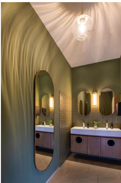
Vince Trattoria_WC Vorraum_Sabine Ringkamp.JPG

Ein Paradies für Weinliebhaber: die gläserne Vinothek mit ihrer Auswahl von über 300 erlesenen Weinen. Ein unverzichtbarer Bestandteil des gastronomischen Erlebnisses in jedem VINCE Lokal.