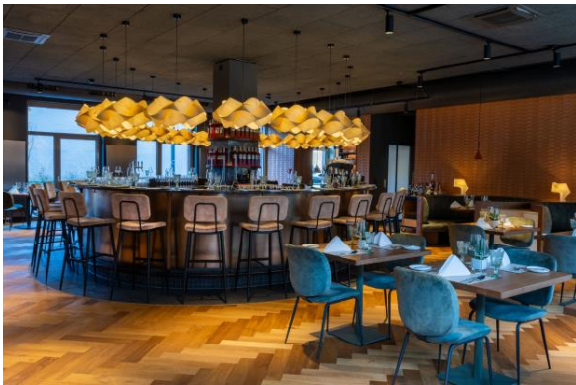
Vince Trattoria_Innen_Sabine Ringkamp.JPG

Am 19m langen Bartresen, der Platz für 20 Gäste bietet, genießen die Besucher der VINCE Trattoria feine raffinierte Gaumenfreunden in Form von Cicchetti – der modernen venezianischen Interpretation von Tapas.