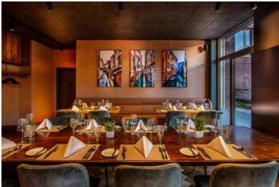
Vince Trattoria_Sitzbank_Sabine Ringkamp.JPG

Für alle, die es etwas privater mögen, bieten die drei runden Sitznischen den perfekten Rückzugsort. Bequem gepolstert in olivgrünem Samt und umhüllt von einer akustisch wirksamen Decke für eine besonders intime Wohlfühlatmosphäre.