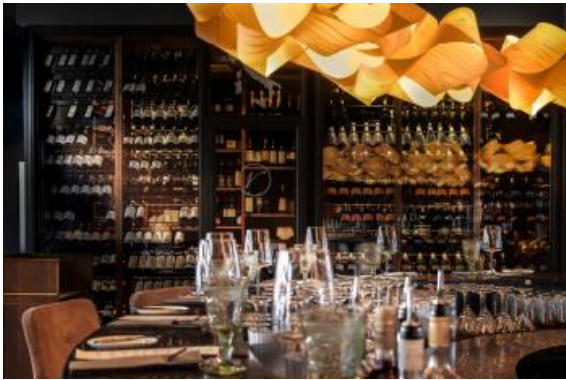
Vince Trattoria_Vinothek_Sabine Ringkamp.JPG

Ein Paradies für Weinliebhaber: die gläserne Vinothek mit ihrer Auswahl von über 300 erlesenen Weinen. Ein unverzichtbarer Bestandteil des gastronomischen Erlebnisses in jedem VINCE Lokal.