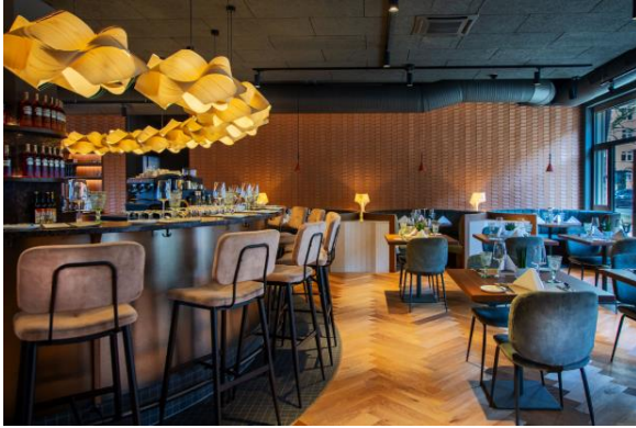
Vince Trattoria_Innen1_Sabine Ringkamp.JPG

Am 19m langen Bartresen, der Platz für 20 Gäste bietet, genießen die Besucher der VINCE Trattoria feine raffinierte Gaumenfreunden in Form von Cicchetti – der modernen venezianischen Interpretation von Tapas.