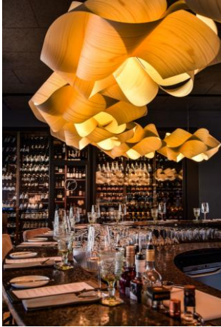
Vince Trattoria_Detail Pastanest_Sabine Ringkamp.JPG