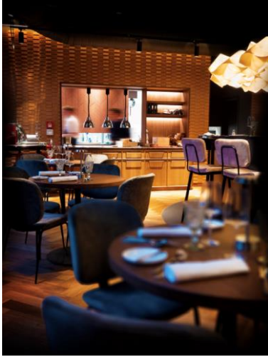
Vince Trattoria_Küchenpass_Brainclash GmbH.JPG