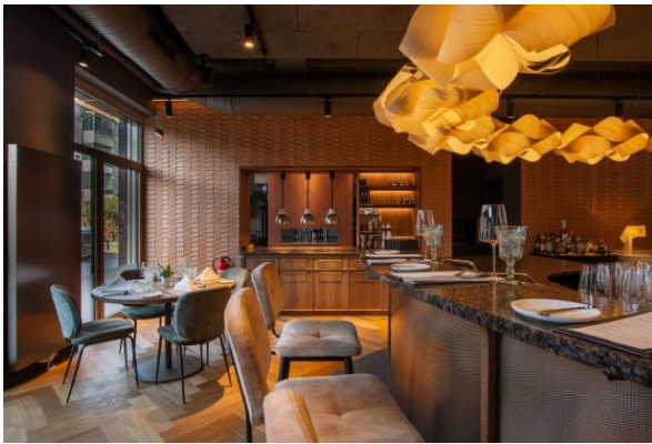
Vince Trattoria_Küchenpass_Sabine Ringkamp.JPG

Ein Blick hinter die Kulissen: Der Küchenpass verbindet Funktionalität und Design, lässt die Gäste den Chefkoch bei der Zubereitung seiner Spezialitäten beobachten und sorgt gleichzeitig für einen reibungslosen Ablauf beim Service, ohne die Gäste bei ihrer genussvollen (Aus)Zeit zu stören.