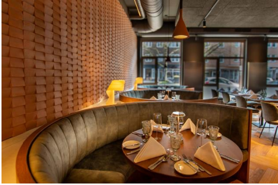
Vince Trattoria_Sitznischen1_Sabine Ringkamp.JPG

Für alle, die es etwas privater mögen, bieten die drei runden Sitznischen den perfekten Rückzugsort. Bequem gepolstert in olivgrünem Samt und umhüllt von einer akustisch wirksamen Decke für eine besonders intime Wohlfühlatmosphäre.