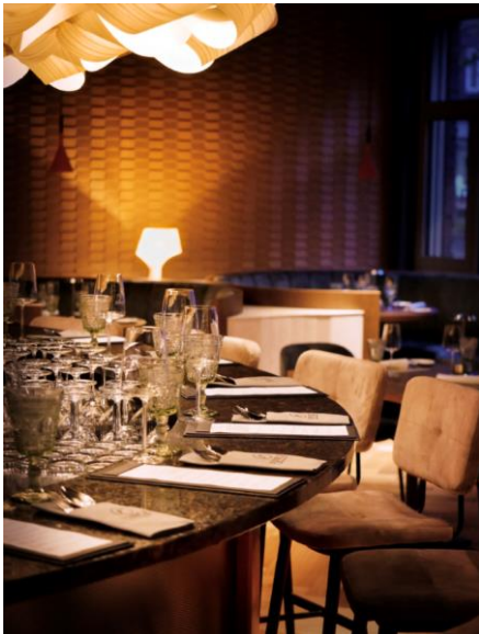
Vince Trattoria_Bar_Brainclash GmbH.JPG