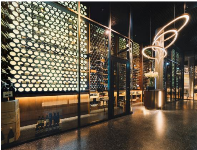
Abb. 2: Die Vinothek als klares Statement, prägt das großzügige, gläserne Entree. Eine große Geste, exklusiv und diskret werden die Gäste im CLAAS willkommen heißen.