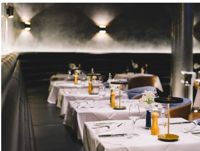
Abb. 6: Die lichtdurchfluteten, pompös gepolsterten Fine Dining Bereiche laden dazu ein die Weite des Raumes zu genießen.