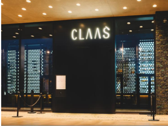
Abb. 1: Ein Schimmern hinter der Fassade lässt bereits aus der Ferne mehr erahnen. Schimmernde Flaschen in goldenen, beleuchteten Röhren machen auf sich aufmerksam.