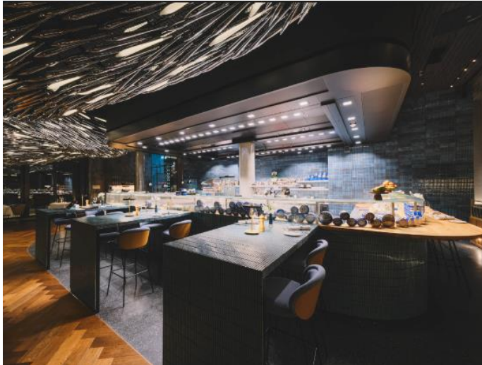
Abb. 7: Die 50m 2 große italienische Design-Showküche mit ihren Champagner- und Austerntischen bietet seinen Gästen den besten Blick auf die Kochkünste des Hausherrn.