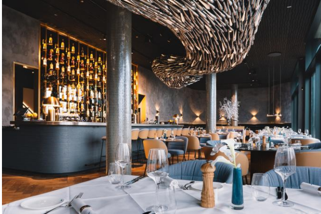
Abb. 4: Alles ist echt im CLAAS. Echte Handwerkskunst an den matten Kalkputz-Wänden, dem gegossenen Terrazzoboden, den maßgefertigten Tischlermöbeln.