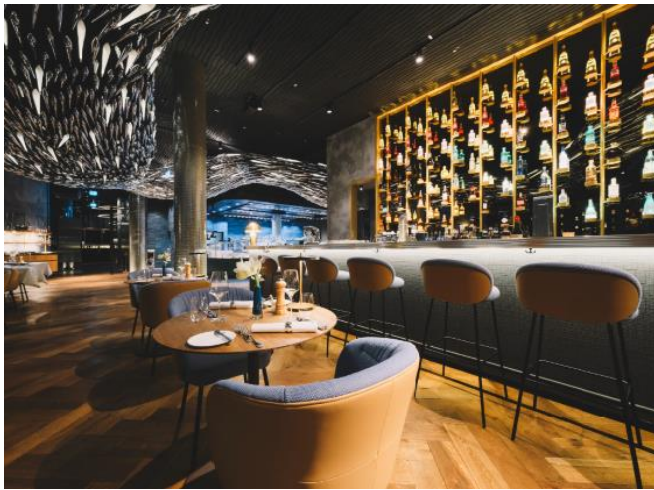
Abb. 5: Die Bar: monumental und filigran ätherisch zugleich. Fugenlose raumhohe Bronzespiegel, scheinbar schwebende leuchtende Flaschen mit Geistvollem zaubern eine Stimmung der goldenen 20er in den Neubau.