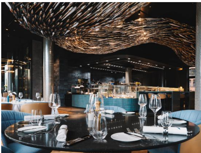
Abb. 3: Fine Dining Bereich mit Blick auf die italienische Design-Showküche und die monumentale, sich bewegende Fische-Schwarm-Installation.