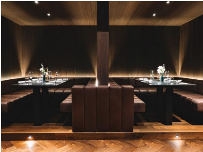
Abb. 8: Wer mehr Intimität und Rückzug sucht, findet diese in den pompös gepolsterten Sitznischen direkt gegenüber der Showküche.