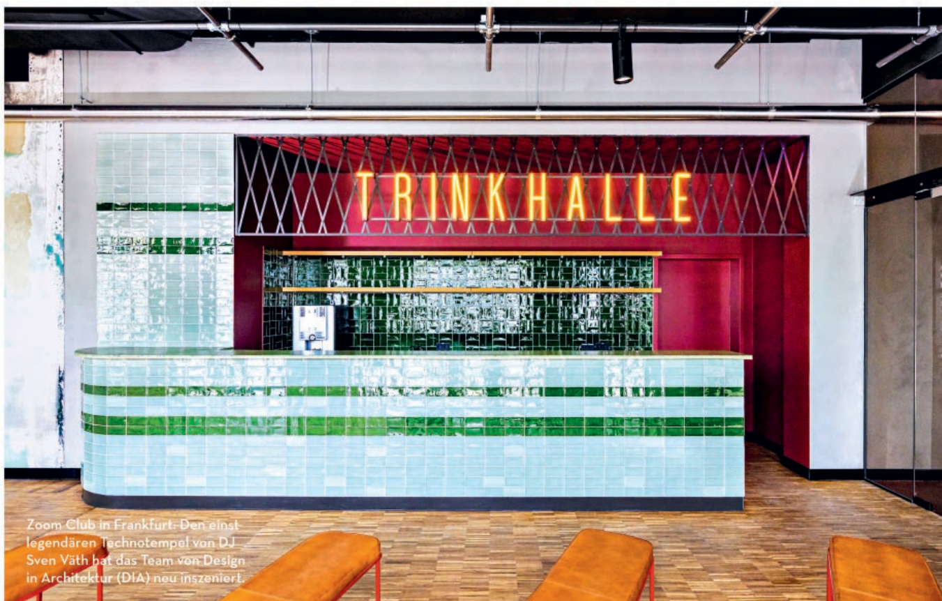
Zoom Club in Frankfurt: Den einst legendären Technotempel von DJ Sven Väth hat das Team von Design in Architektur (DIA) neu inszeniert.

reichen. Aus den Hunderten Projekten setzte die Jury fünfzig mit einer Auszeichnung in den drei Kategorien Restaurant, Bar und Café & Bistro auf die Shortlist. Neben dem gehobenen gestalterischen und gastronomischen Niveau punkteten die Locations mit ihrer inhaltlichen Bandbreite und konzeptionellen Vielfältigkeit: von der Stuttgarter Brothandlung Grau im Schaufensterambiente bis zum temporären Kiez Kaffee Kraft in Berlin-Pankow, vom innovativen Restaurant Yaya in Münster mit seinen Kochrobotern bis zur stylishen Kölner Kaviarboutique Prunier Cologne.